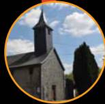
Chapelle Saint Roch de la Maladrie