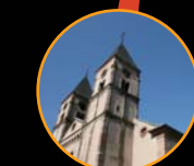
Eglise Saint Barthélemy Place du marché