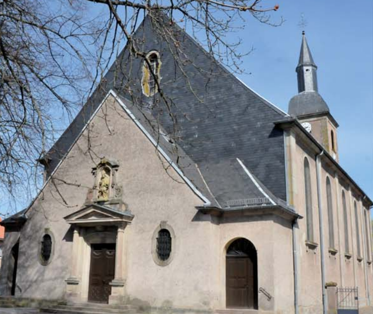
Eglise Saint Martin de Hoff

Construite au XIV ème siècle, reconstruite deux fois au XVII ème . Intérieur : Riche décor baroque dont plusieurs œuvres classées.