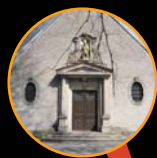
Eglise Saint Martin Hoff