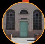
Synagogue Rue du Sauvage