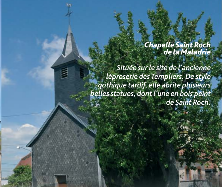
Chapelle Saint Roch de la Maladrie

Située sur le site de l'ancienne léproserie des Templiers. De style gothique tardif, elle abrite plusieurs belles statues, dont l'une en bois peint de Saint Roch.